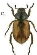
6 Phyllopertha horticola Il maggiolino degli orti, 8-10 mm, possiede molto peli diffusi sull'addome che non si distinguono in ciuffi.