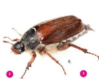
2 Melolontha melolontha Il comune maggiolino, 25-30 mm, non possiede ciuffi bianchi.