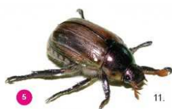
5 Mimela junii Il giugnino Mimela junii , 13-16 mm, possiede elitre di colore verde dorato e molti peli diffusi che non si distinguono in ciuffi bianchi. Ha una forma più ovale rispetto al coleottero giapponese.