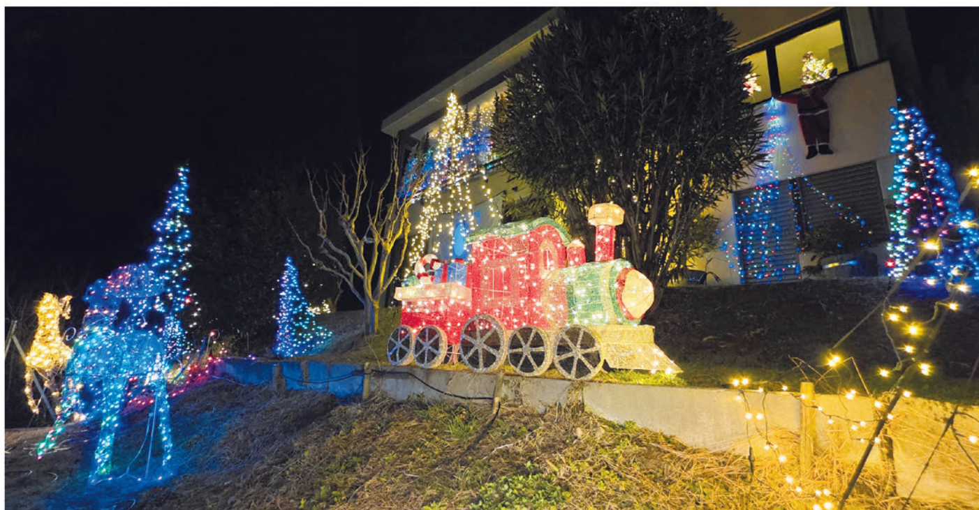
La finestra dell’avvento della Famiglia Schmid il 15 dicembre.

Buona lettura fra tutti gli avvenimenti e l’importante resoconto del Consiglio comunale, che detterà in futuro l’agenda della nostra “Voce”, la vostra “Voce”... quella di Savosa.