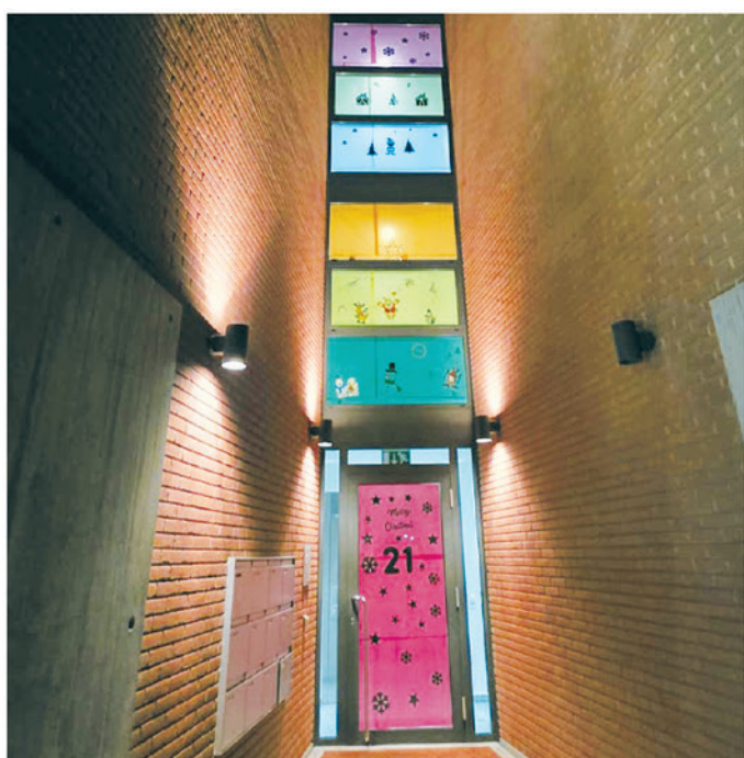
21. Famiglie di Via San Gottardo 142