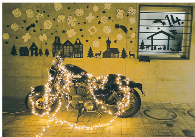
14. Famiglia Casanova-Ferrini, Via Navone 27