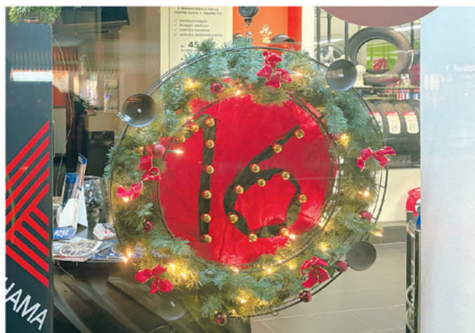
16. Vulcan SA, Via San Gottardo 135