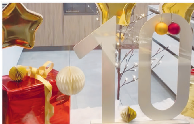
10. Cucina Moderna SA, Via San Gottardo 135