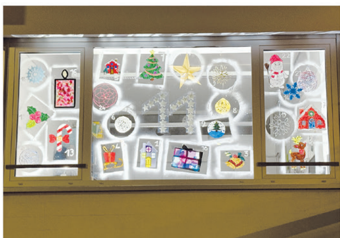
11. Scuola Elementare