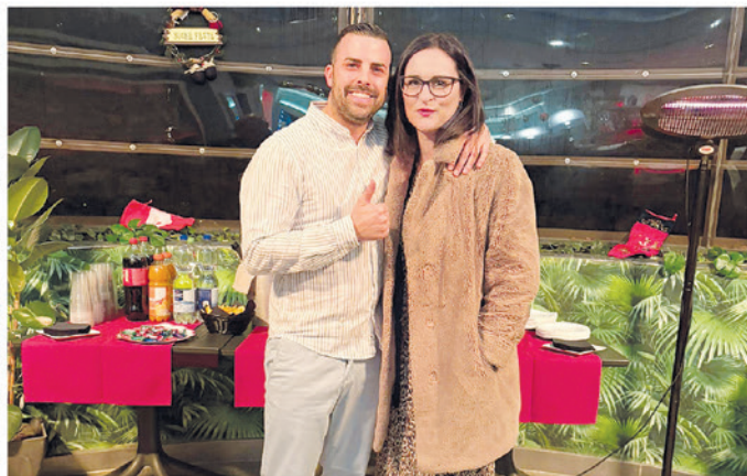
1. Bar al Passaparola, Via San Gottardo 139

zate con cura e fantasia da famiglie e negozianti del nostro paese.