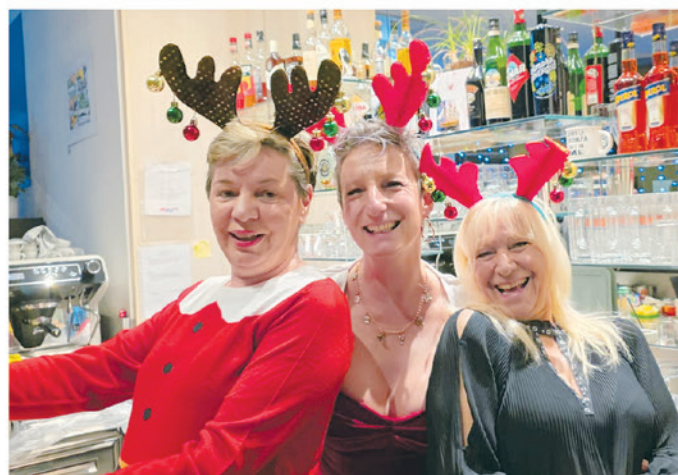
22. Bar Cuba, Via San Gottardo 160