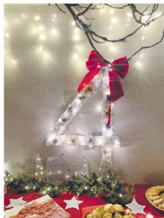
4. Famiglia Lazarevic e Bubanja, Via Campo dei Fiori 32