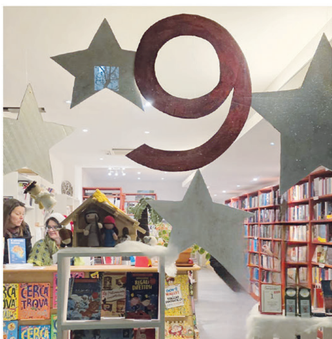
9. La Libreria del Tempo Sagl, Via San Gottardo 156