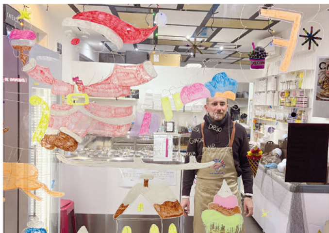
7. Gelatiamo, Via San Gottardo 137