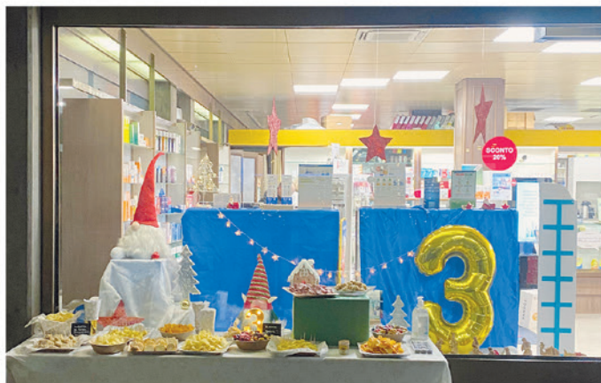
3. Farmacia del Crocefisso SA, Via San Gottardo 154