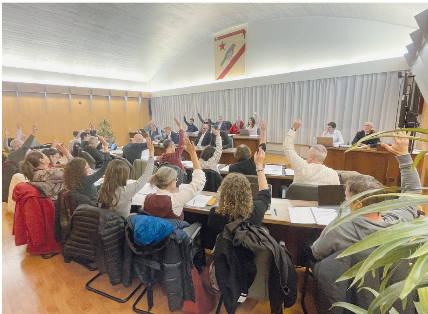
Un momento della seduta del Consiglio comunale.

In data 1. dicembre 2025 si è tenuta la seconda sessione ordinaria del Consiglio comunale; presenti tutti i Consiglieri comunali con i lavori che si sono aperti alle ore 20:00.