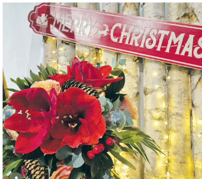
20. Floraticino, Via San Gottardo 146