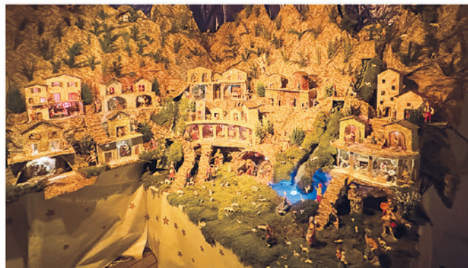
8. Famiglia Donno, Via Campo dei Fiori 1