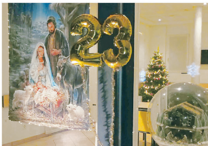
23. Centro Ricreativo al Pettiroso, Via Cantonale 7