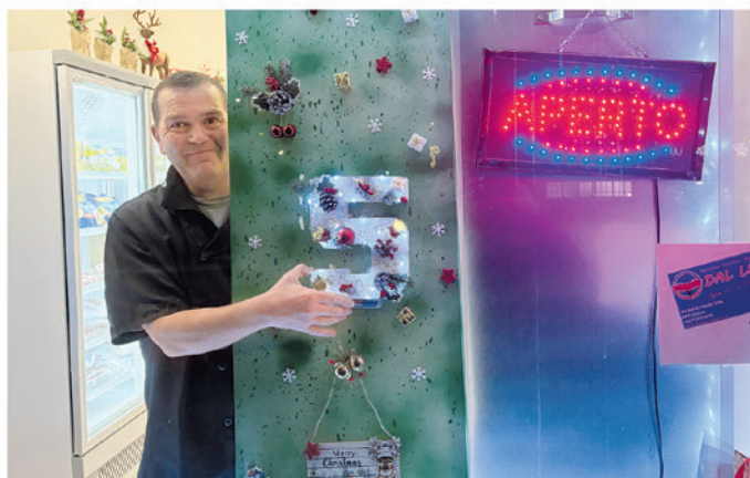
5. Macelleria dal Lùis, Via San Gottardo 139A