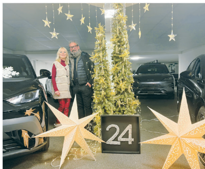
24. Automotive Bernasconi SA, Via San Gottardo 143