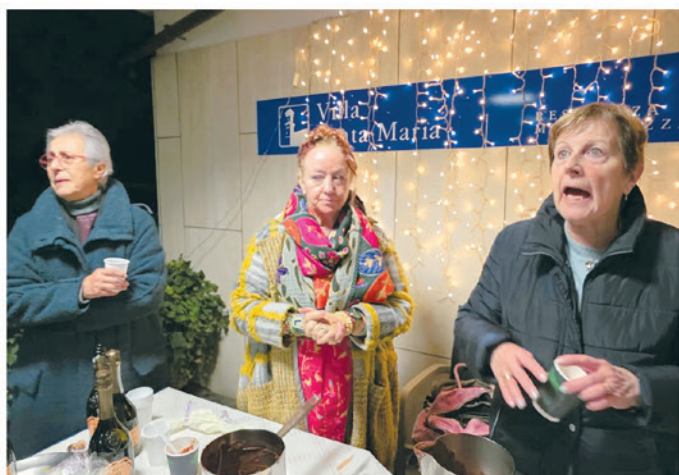
17. Villa Santa Maria, Via Cantonale 15