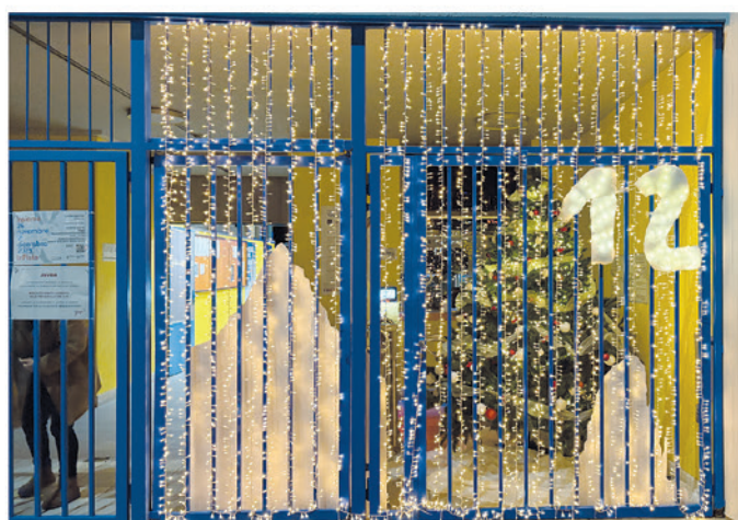
12. Municipio di Savosa c/o pista di pattinaggio Valgersa