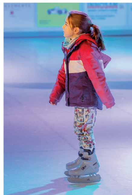
"Insieme InPista" presso il Centro sportivo Valgersa.

LA VOCE DI SAVOSA Semestrale di informazione del Comune di Savosa Numero 1 / Anno 2026 CAPO REDATTORE Alessandro Tamburini