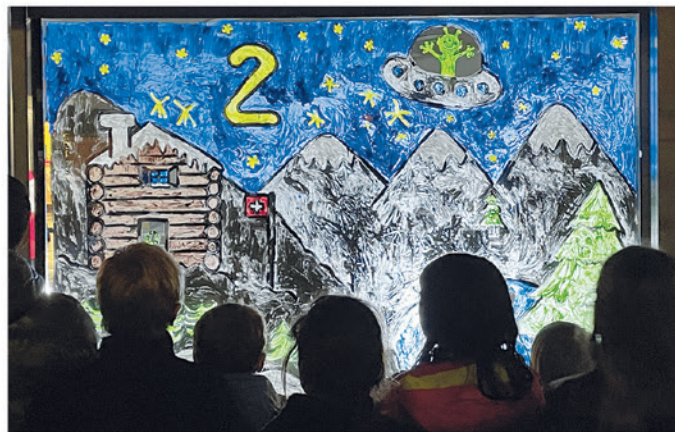
2. Scuola dell'Infanzia