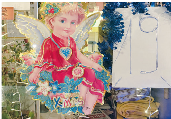
19. Bar Siesta, Via Cantonale 3